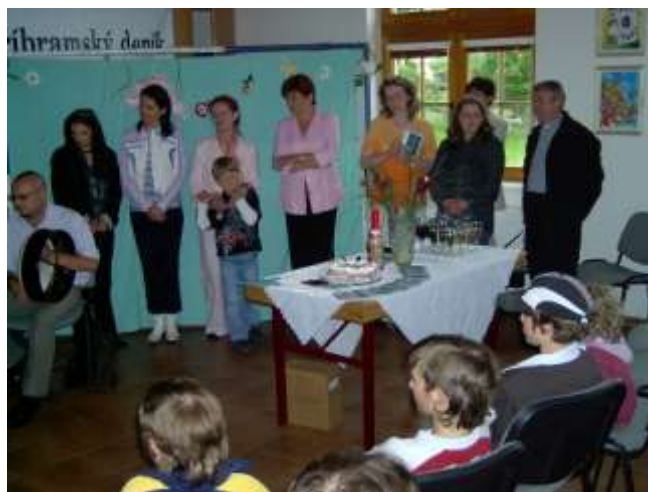
Křest charitativního CD - 27. 5. 2006.