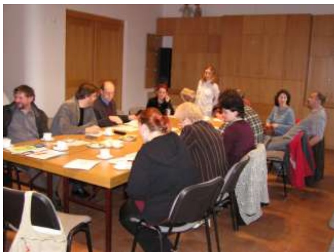
Setkání u kulatého stolu - 19. 4. 2006.