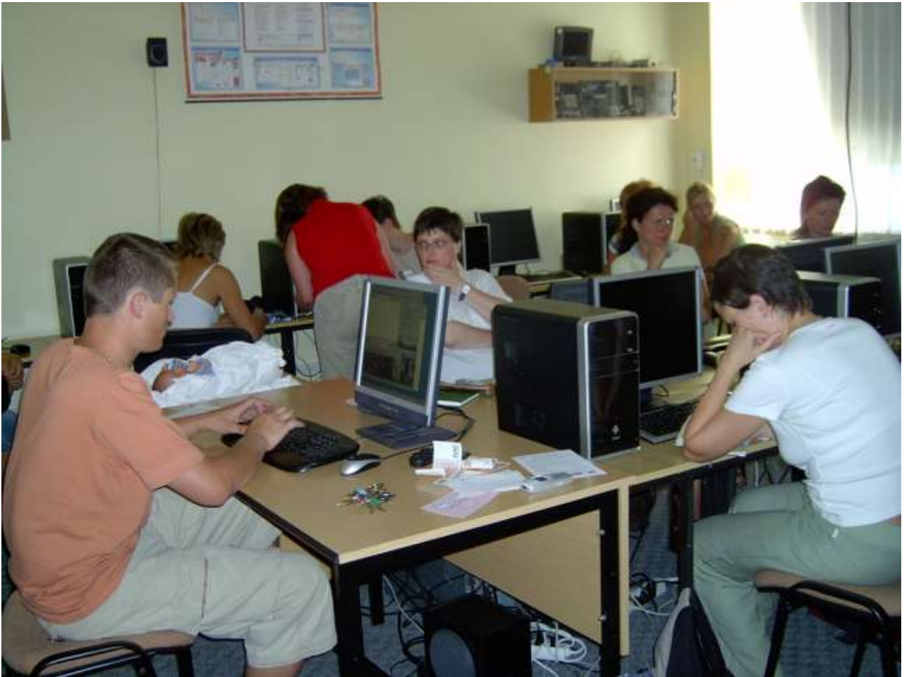
Počítačový kurz pro pokročilé v rámci projektu „Zpět do práce“.